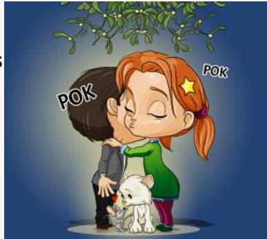
http://www.reseau-canope.fr/tes/skeudennaoueg/skeudennoù krouet gant Malo Ar Menn